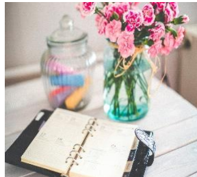
Save the Date – Veranstaltung 2019